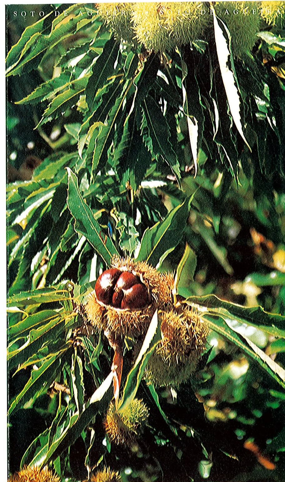
"Ourizos" de los castaños en otoño